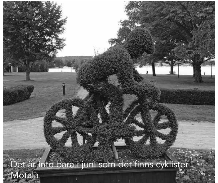
Det är inte bara i juni som det finns cyklister i Motala