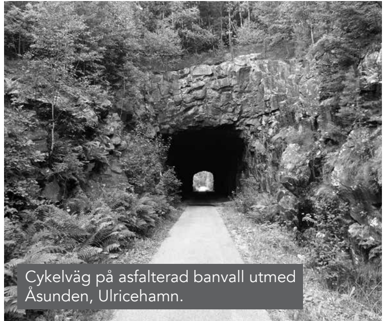
Cykelväg på asfalterad banvall utmed Åsunden, Ulricehamn.