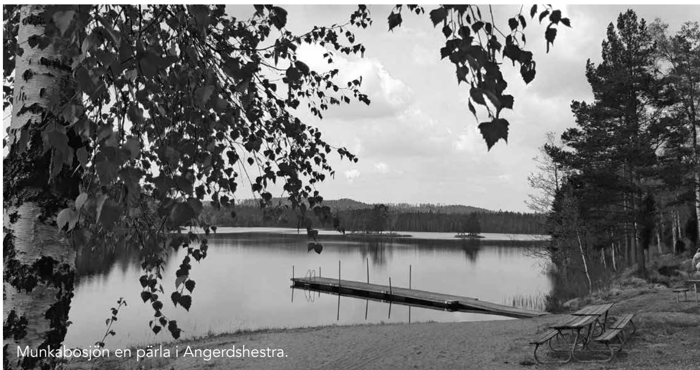
Munkabosjön en pärla i Angerdshestra.

Det finns ett uttryck som säger: Gräv där du står! Det var precis så vi tänkte när vi för 16 år sedan bestämde att en heldag åka ut och njuta av Guds natur på nära håll. Vi ville bara göra verklighet av att uppleva allt fint som är gratis och som finns bara ”runt hörnet”. Helt enkelt klimatsmart, redan då. Eftersom vi är livsnjutare vad det gäller bad blev inriktningen just det.