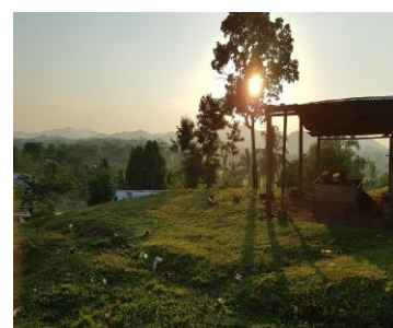
Solnedgång över de gröna kullarna i Sakalwas, Las Minas.