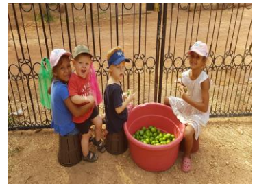
Barnens initiativ att sälja mango vid grinden.