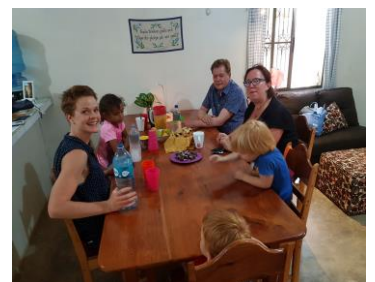
Efterlängtat besök från Sverige firas med mango och chokladbollar.