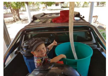
Laban gillar att följa med och hämta vatten.