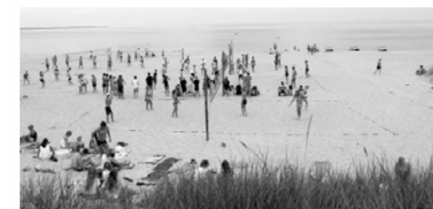
Häng på stranden - Bödaläget 2015